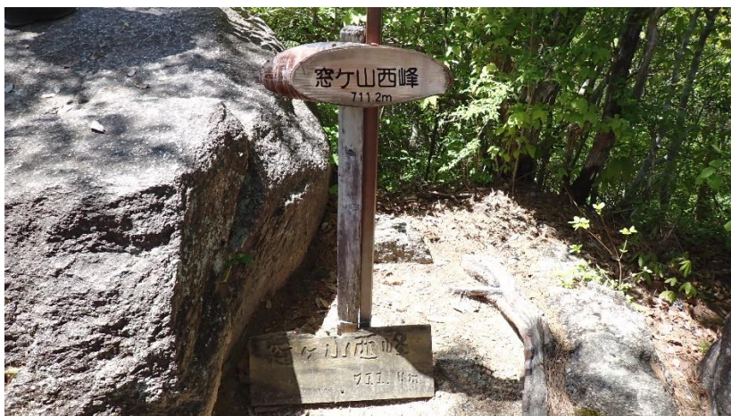
安佐岳友クラブ 大藤