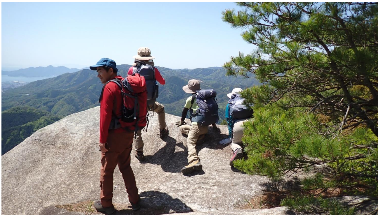
おんな岩からの展望